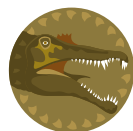
Parco delle Estinzioni