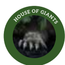
Casa dei Giganti